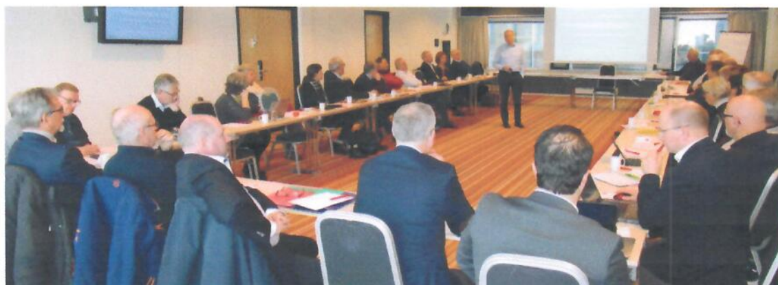
Et kjent motiv /møterom for flere årskull med DG'er og andre tillitsvalgte i Norfo! Budsjett- og strategimøtet 3. februar 2018 samlet DGE'er og andre sentrale personer fra distriktene og Norfos støtteapparat.